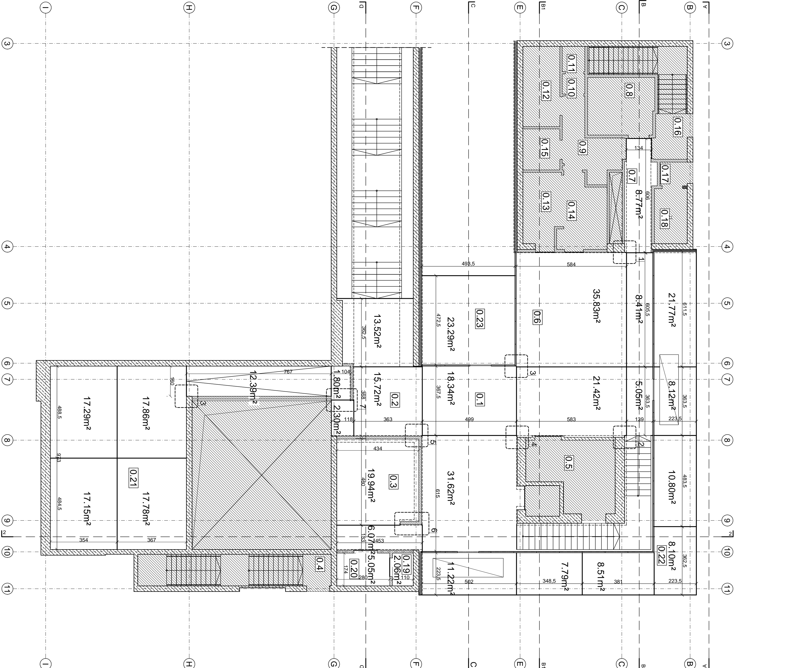
poziom 0 1:100